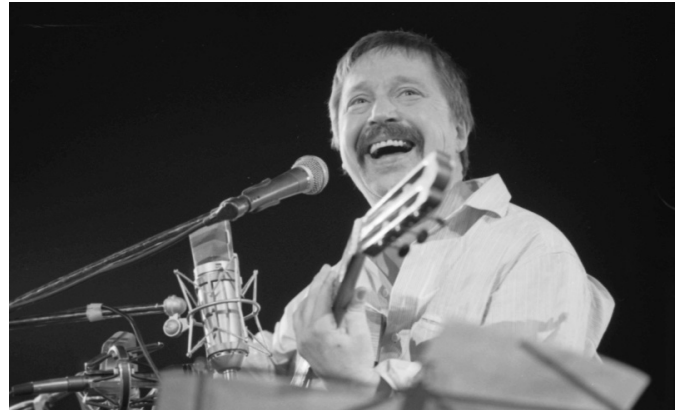
Biermann bei seinem Konzert in Leipzig, 1.12.1989

Nach dem Zweiten Weltkrieg trat Wolf Biermann den Jungen Pionieren bei und vertrat 1950 die Bundesrepublik Deutschland beim 1. Deutschlandtreffen der Jugend in der DDR.